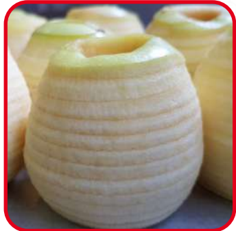
Pelage / Etrougnage / Tranchage