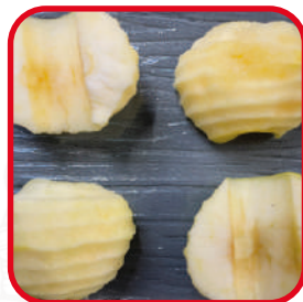
Divisée en 2