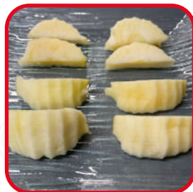
Divisée en 8