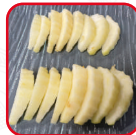
Divisée en 16