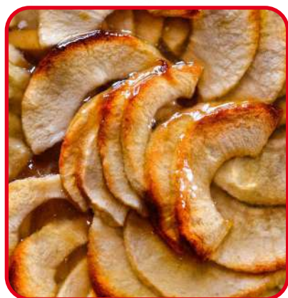
Tartes aux pommes