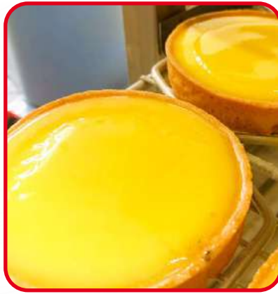
Tartelettes au citron