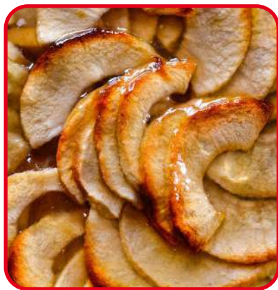
Tartes aux pommes