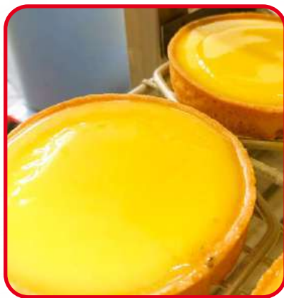
Tartelettes au citron