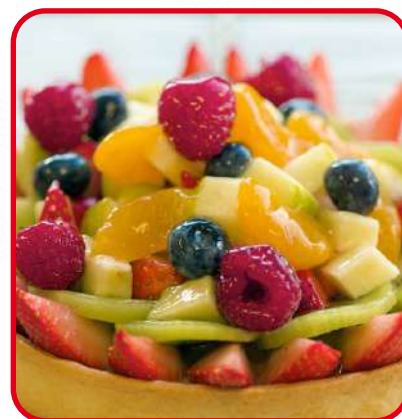
Tartelettes aux fruits