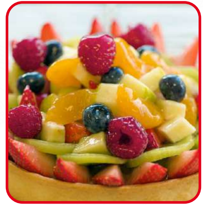
Tartelettes aux fruits