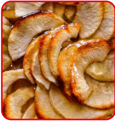
Tartes aux pommes