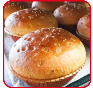
Burgers / Buns