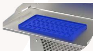
Tirette extractible et réglable sur quatre niveaux de hauteur