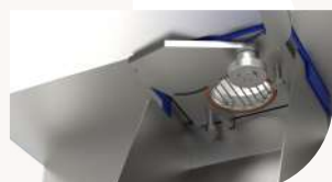
Poignée d'extraction en position ouverte