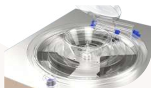
Cuve ouverte et bras de mélange